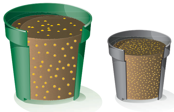
Distribución de gránulos de Osmocote estándar en una maceta de 10 cm (4 pulg.)